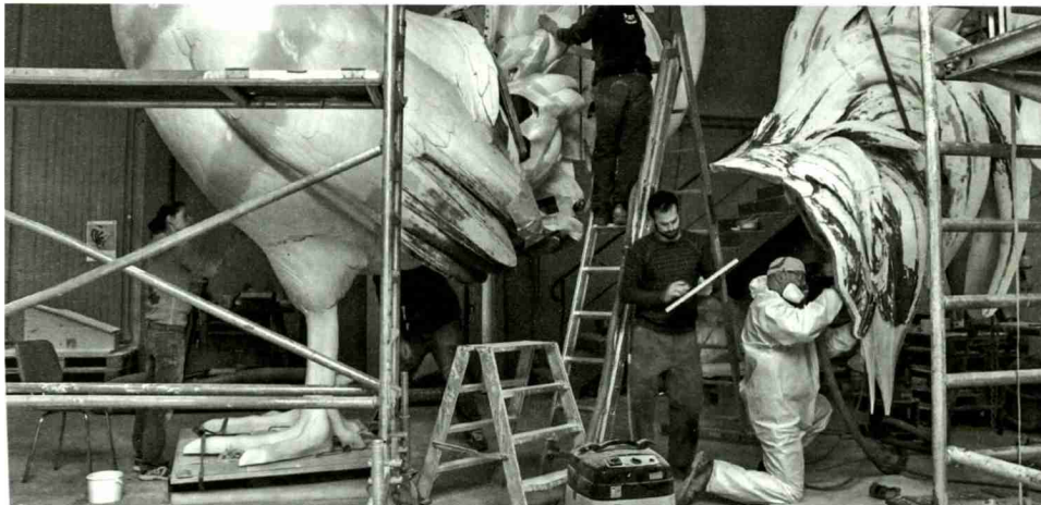
Arbeiten an Katharina Fritschs Hahn. Filmstil.